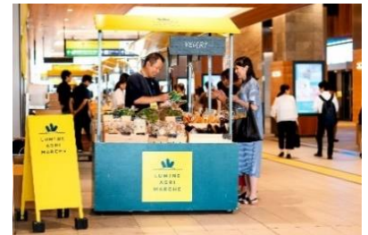
▲LUMINE AGRI MARCHE