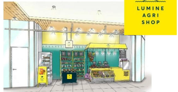
▲左：イメージ図／右：ロゴ

ショップ名 : 「LUMINE AGRI SHOP」 場所 : ニュウマン新宿 2F エキナカ ※改札内の店舗になります。ご利用にはJRの入場券が必要です。 オープン日 : 9月14日（火） 営業時間 : 月～土 8:00～21:00 日祝 8:00～20:00 ※最新の営業時間は直接店舗へご確認ください。 電話番号 : 03-5315-0835 ホームページ : https://www.lumine.ne.jp/agri/ Instagram : @lumine_agrimarche WEB STORE : https://www.jreastmall.com/shop/c/c40/